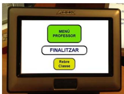
Clic a Menú Professor